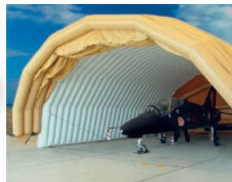
Aufblasbare Flugzeughalle von Lindstrand Technologies, UK

GORE™ TENARA® Nähfäden sind aufgrund ihrer Charakteristik auch für zahlreiche industrielle Anwendungen geeignet.