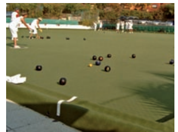
Kunstrasen von Greengauge Surfaces, UK